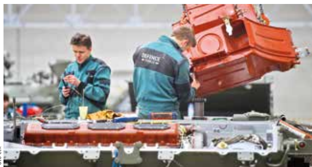
ARMÁDNÍ DODAVATEL. Do průmyslového holdingu CSG patří také vojenská odnož kopřivnické automobilky Tatra Defence.

„Loni jsme neuskutečnili žádnou významnou akvizici, soustředili jsme se na fungování všech holdingových společností. Právě do nich a do jejich produktů směro-