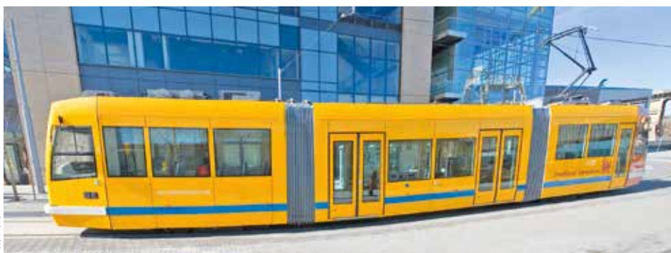
PRODUKCE PRO USA. Tyto nízkopodlažní tramvaje vyráběl Inekon v Ostravě a dodal je do Seattlu.

„Nemáme volnou kapacitu na zpracování znaleckého posudku. S ohledem na to, že jsme ustanoveni znalcem i v jiných řízeních, jsme schopni ocenit majetkovou podstatu společnosti Inekon Group až na přelomu září